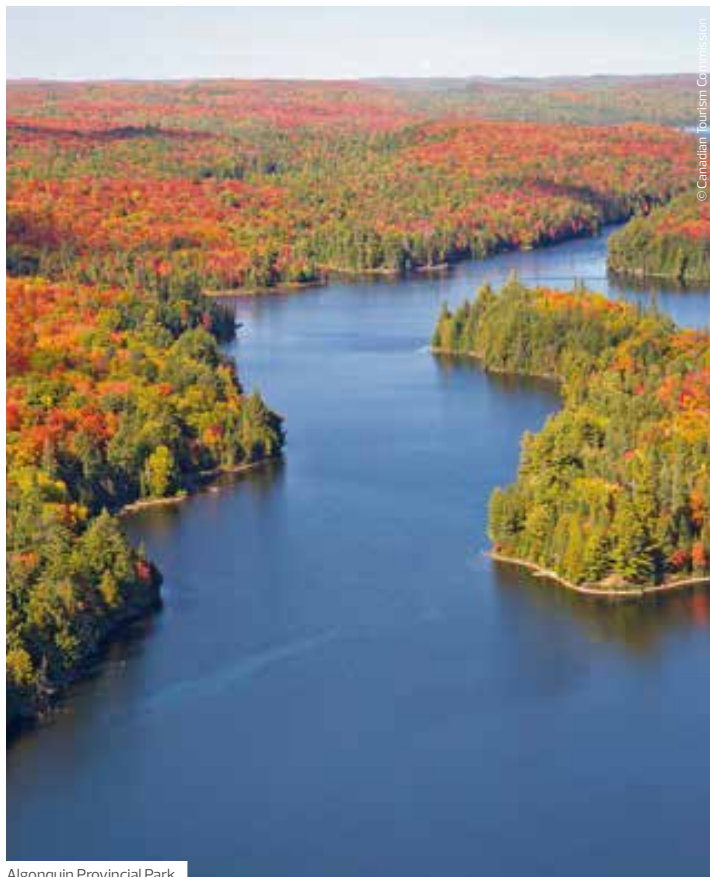
Algonquin Provincial Park

Rundreise inkl. Flug ab/bis Deutschland pro Person ab € 2.266