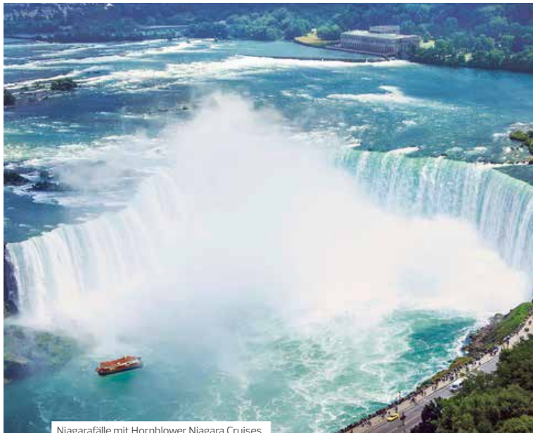
Niagarafälle mit Hornblower Niagara Cruises