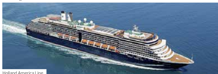
Holland America Line

Schnuppern Sie die Bergluft in den kanadischen Rocky Mountains und genießen Sie die Ruhe in malerisch bewaldeten Tälern. An der Westküste erwarten Sie zwei Tage in Vancouver. Im Anschluss gehen Sie auf Kreuzfahrt an Bord der Nieuw Amsterdam und erkunden die maritime Welt bis in den Norden nach Alaska.