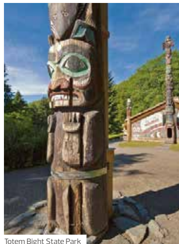
Totem Bight State Park